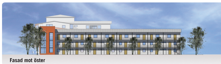
Fasad mot öster