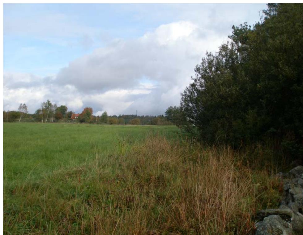
UTBLICK FRÅN OMRÅDET MOT NORR