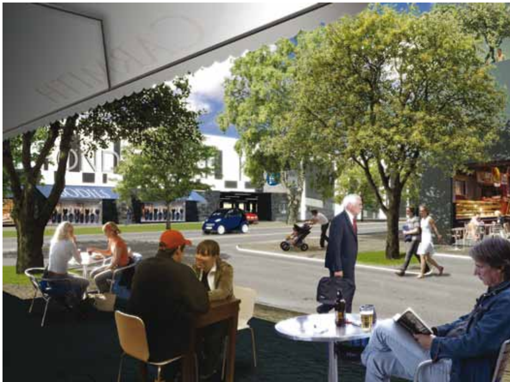
Illustration: Arkitekterna Krook & Tjäder