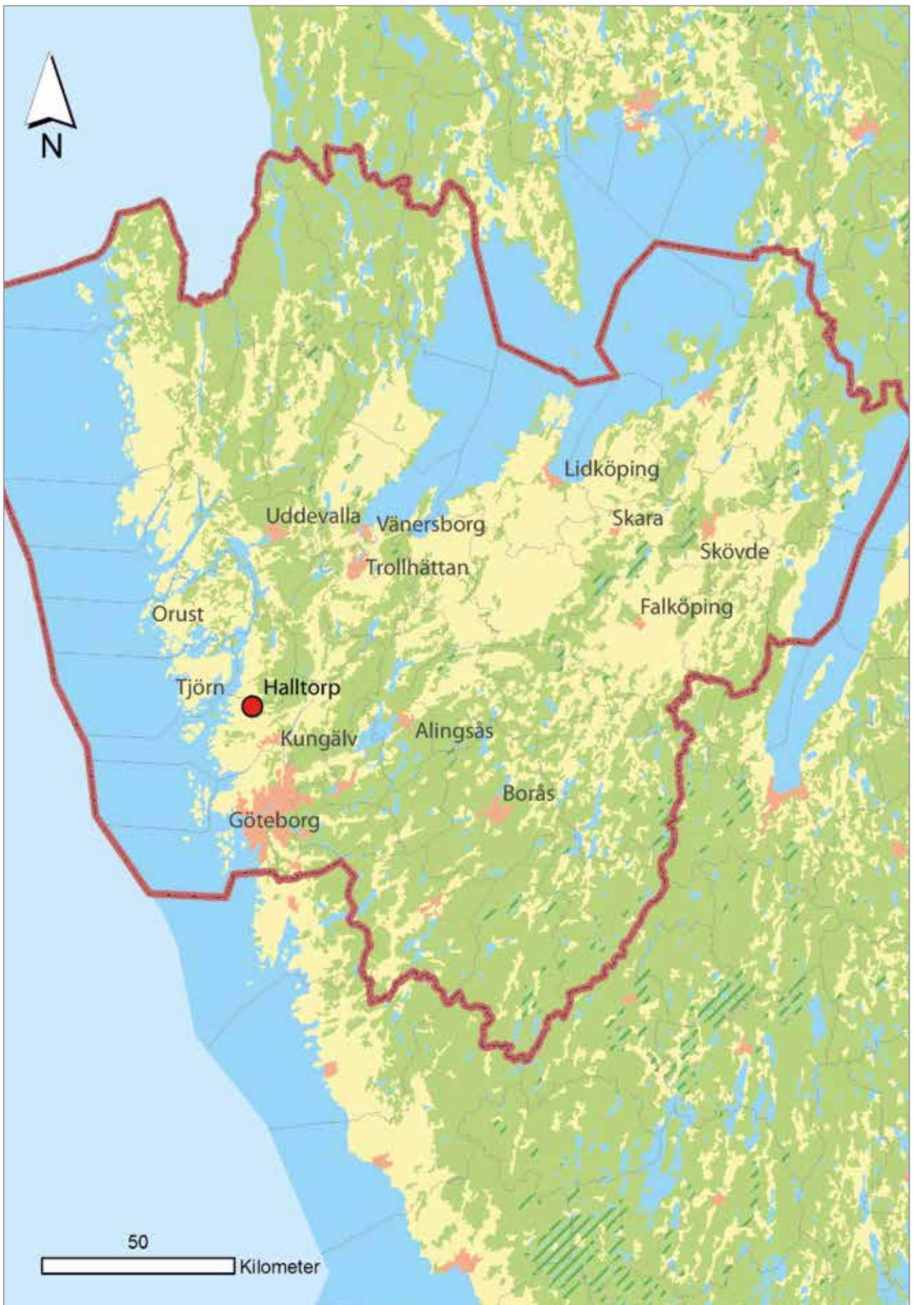
Figur 1. Utdrag ur över GSD-Sverigekartan över Västra Götalands län med platsen för utredningen markerad.