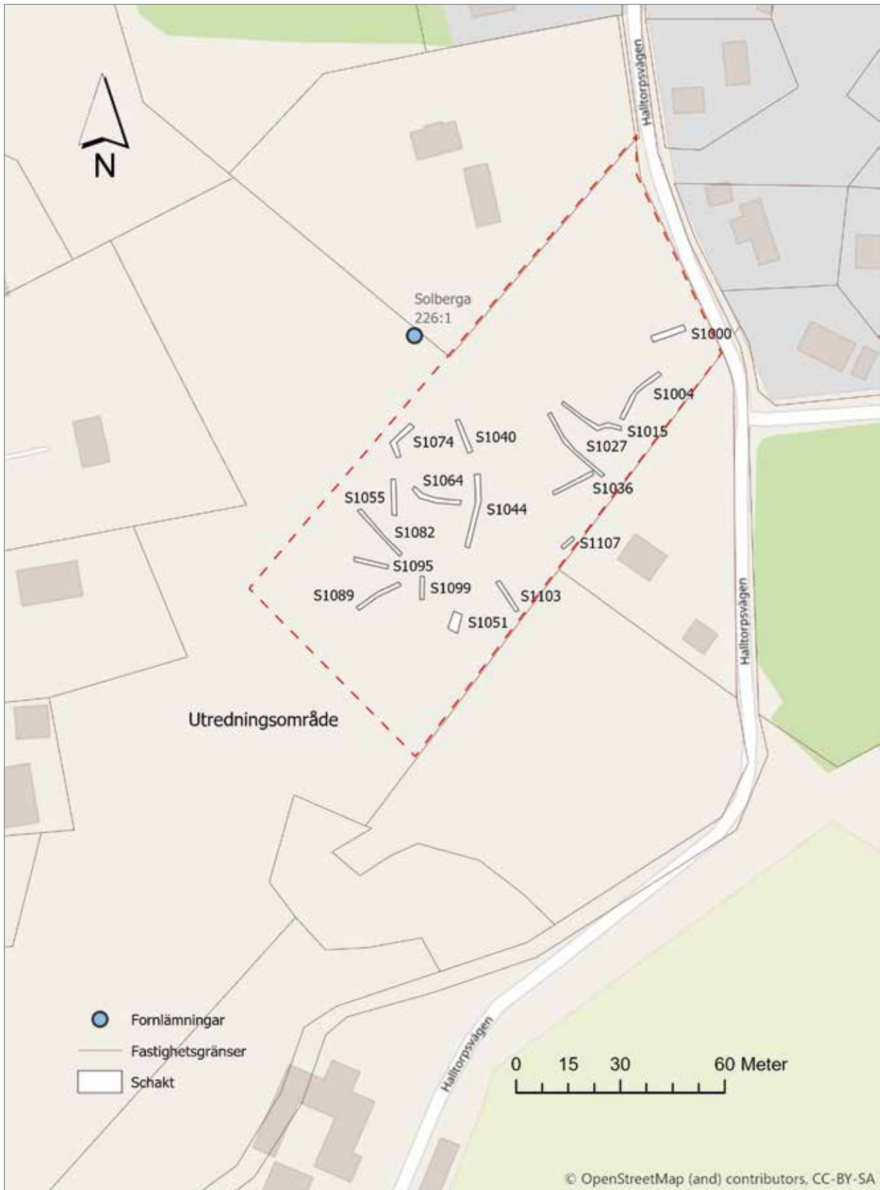
Figur 5. Utdrag ur GSD-fastighetskartan med samtliga schakt markerade.