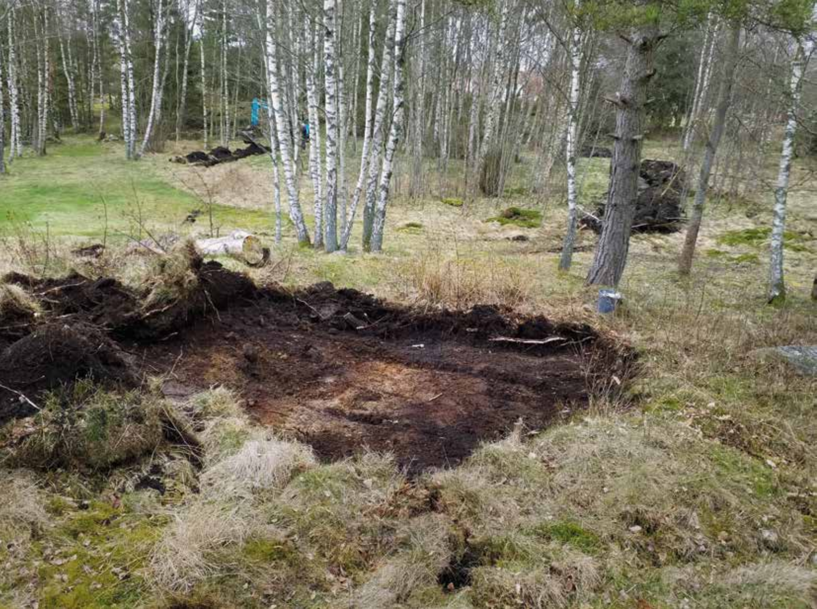
Figur 3. Schaktning bland björkarna inom utredningsområdet (schakt 1051 syns i förgrunden).