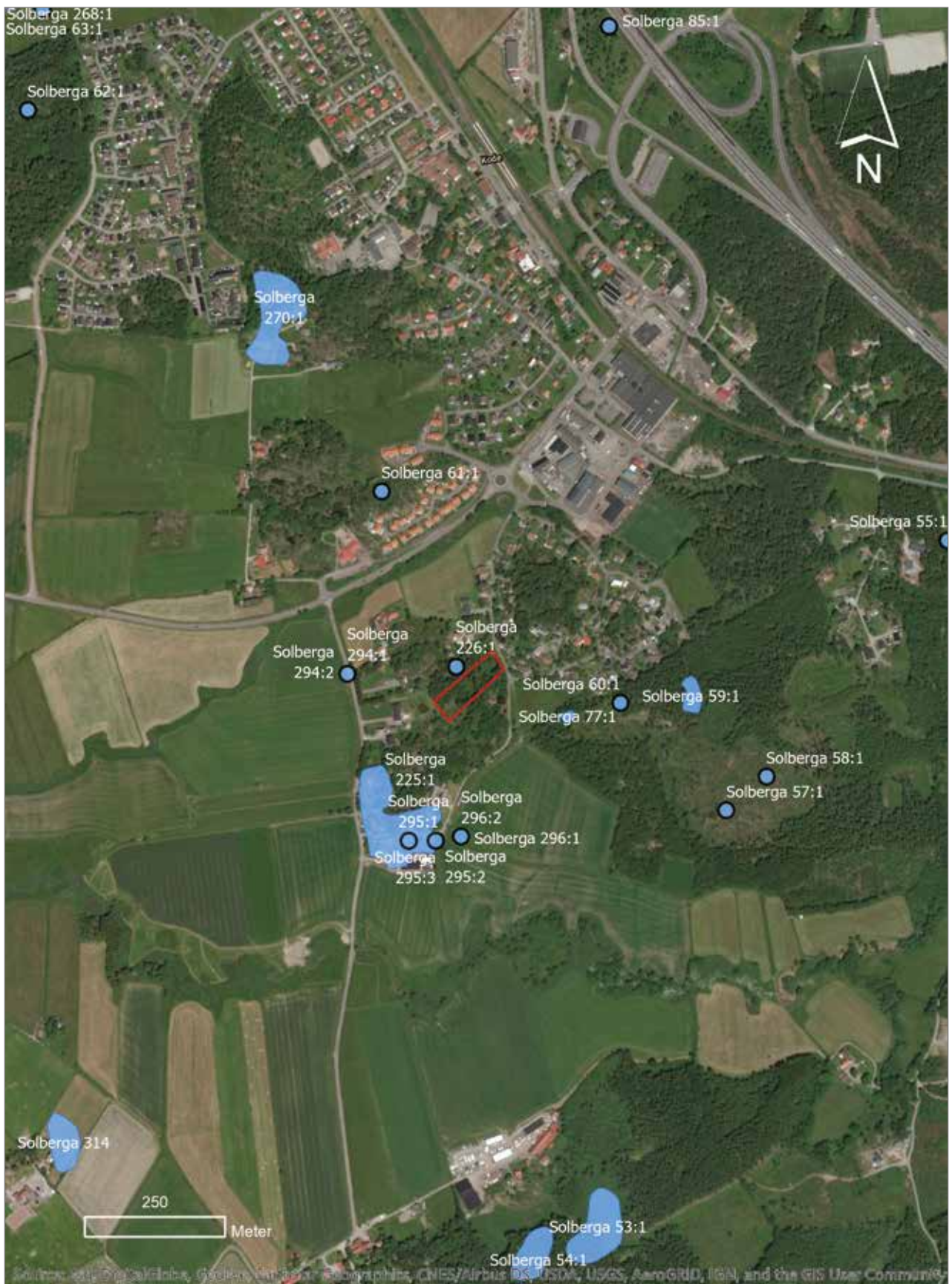
Figur 4. Utdrag ur Esri, Digital Globe i skala 1:10 000 som visar förundersökningsområdet som en rektangel samt omgivande fornlämningar.