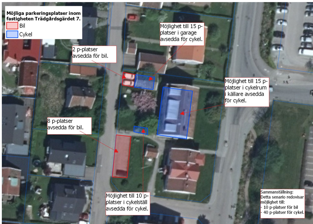
Figur 2: Bilden illustrerar ett scenario med möjlighet att lösa parkeringsplatser inom Trädgårdsgärdet 7.