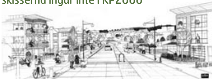
Kongahällagatan från motorvägsbron. Bostäder på norra sidan.