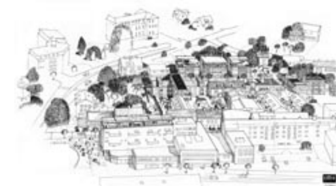
Ömvandling av bakgårdarna mellan Västra gatan och Fontinvägen.