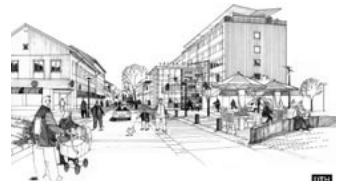
Västra gatan från norr.