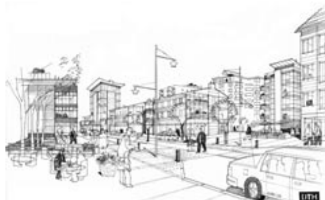
Ny bebyggelse på busstorget. Uddevallavägen enligt konceptet från Strandgatan.