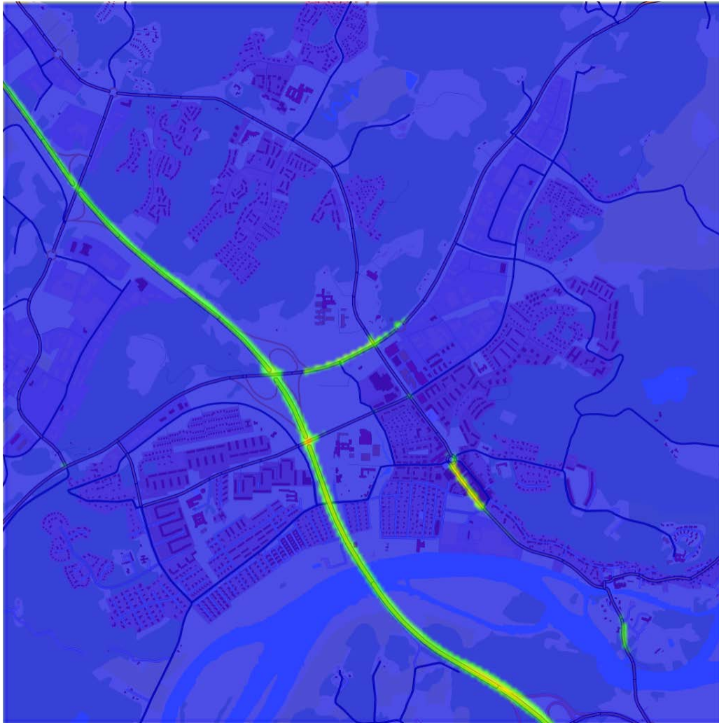
Figur 1. Beräknat årsmedelvärde för kvävedioxidhalter i Kungälv tätort i Kungälv kommun år 2015.