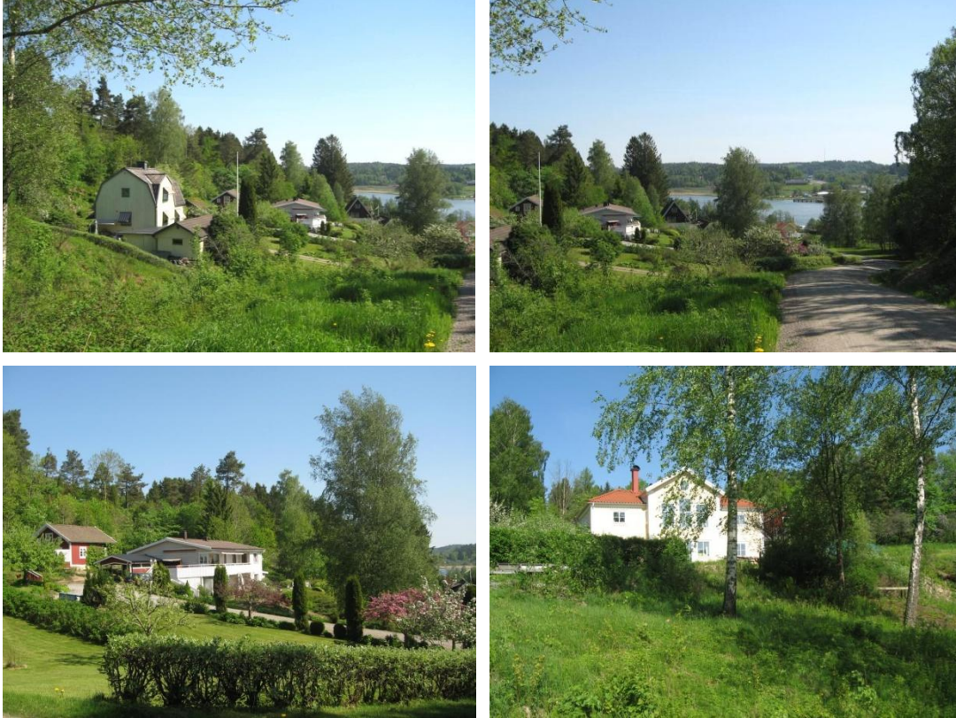
Stora trädgårdar, utblickar och en blandning av nyare och äldre bebyggelse kännetecknar området.

Styrdokumentet Bostadsförsörjningsprogram för Kungälv kommun 2013-2022 anger som mål för kommunens planeringsberedskap att den ska möjliggöra färdigställande av 400 bostäder per år. Störst andel bostäder ska tillkomma inom tätortsavgränsningen, i närhet av kollektivtrafik, men även de så kallade serviceorterna, däribland Diseröd, ska ges möjlighet till utveckling och komplettering.