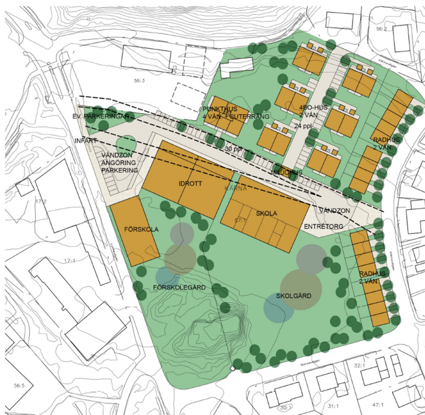
Skiss – Situationsplan

Bostäder angör från Kärnavägen öster om planområdet medan de mer trafikalkstrande verksamheterna har sin angöring via Lyckevägen i väst.