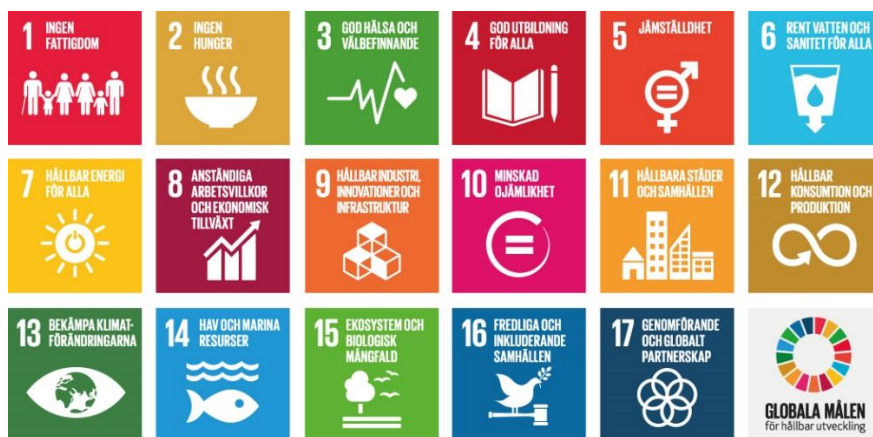
Figur 1. FNs 17 globala mål för hållbar utveckling (UNDP, 2016).

Dagvattenplanen har koppling till FNs globala mål för hållbar utveckling, vilka har tagits fram i syfte att skapa förutsättningar för att succesivt uppnå en hållbar samhällsutveckling fram till 2030 (UNDP, 2016). Totalt har FN satt upp 17 mål, vilka visas i Figur 1.